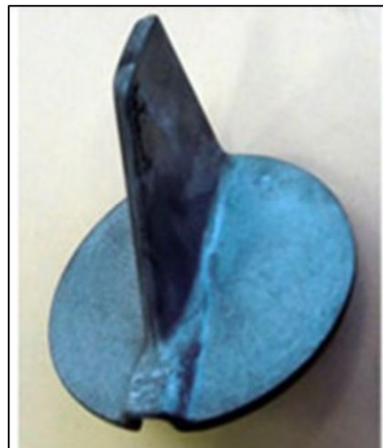
劣化したアノード