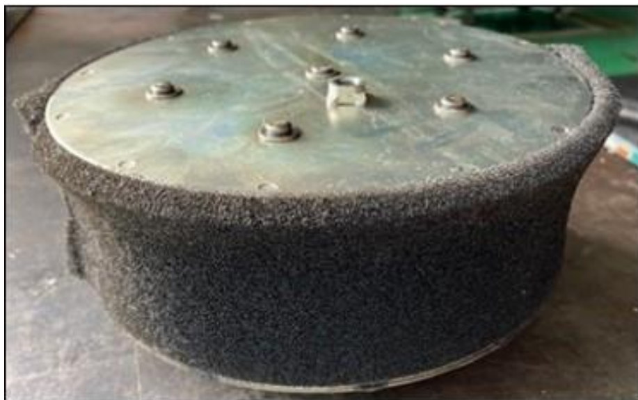
新品のエアフィルタ