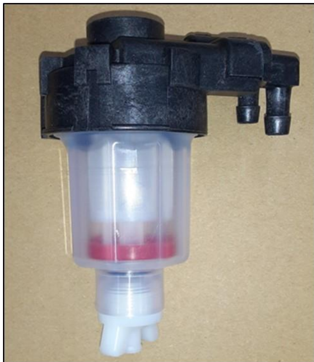
新品の燃料フィルタ

燃料フィルタは燃料系に混入した異物などをろ過します。燃料フィルタはろ過を繰り返すと目詰まりします。