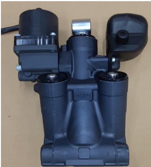
新品のパワートリム