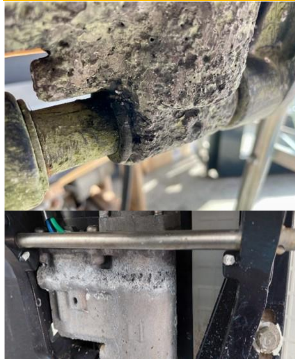
腐食したパワートリム